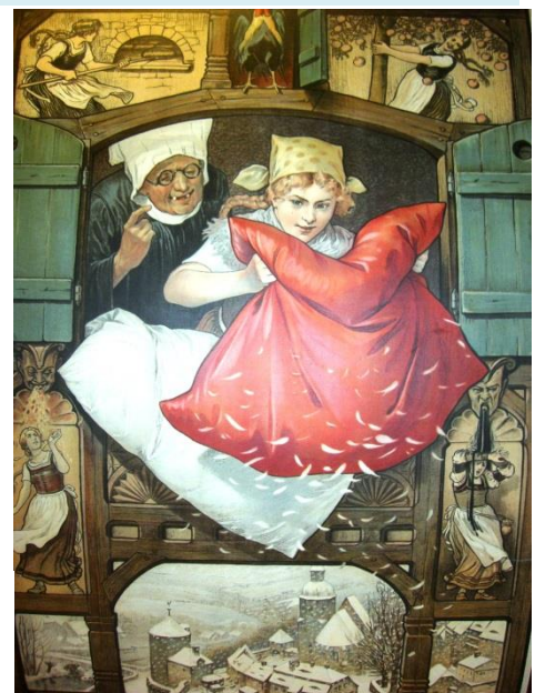
Frau Holle Märchenpostkarte Märchen Nr.13.