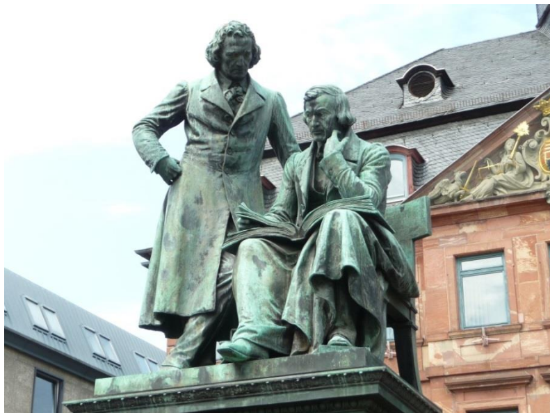
Das Brüder Grimm-Nationaldenkmal in Hanau