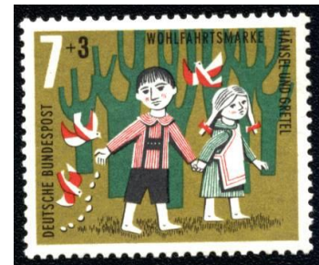
Briefmarken aus der Serie der Wohlfahrtsmarken von 1959 bis 1967 mit Motiven der Märchen der Brüder Grimm