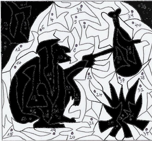
Urmensch / wilder Mann in der Höhle